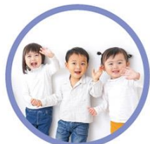
1列に3人座らせられます 【※適合車種のみ】