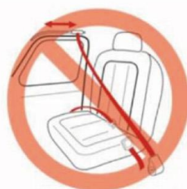
電動シートベルト