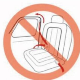
ドアから出ている シートベルト